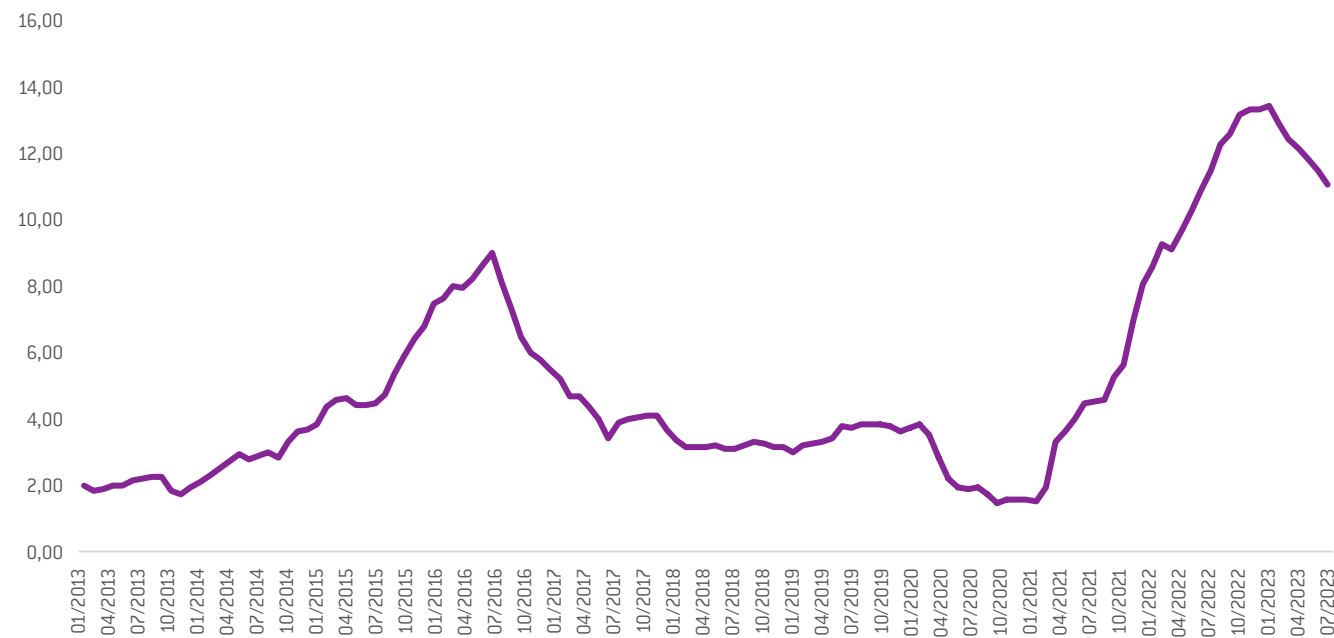
Gráfica 2. Inflación (% anual).